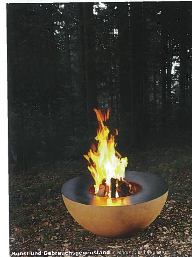
Kunst und Gebrauchsgegenstand in einem: der Feuerring