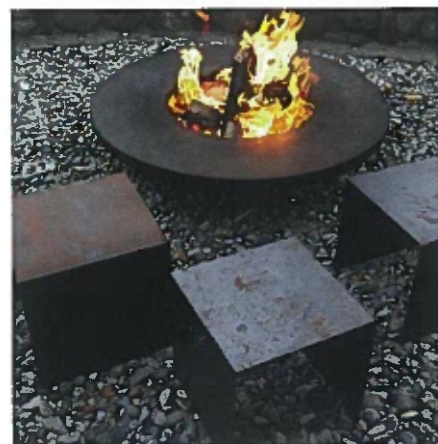
Der Feuerring als moderner und styliher Feuerplatz

Mit dem Feuerring wird ein Stück Lebensphilosophie weitergegeben, bei dem Geselligkeit und Genuss im Vordergrund stehen. Das Ambiente des knisternden offenen Feuers vereint sich mit einer gesunden Ernährungsphilosophie. „Mit Kunst grillieren“ heisst: Feuer in seiner ursprünglichen Art geniessen. Über Jahrhunderte war der Feuerplatz das Zentrum gemeinschaftlichen Lebens. Wärme, Licht, Geselligkeit und gesunde Ernährung sind heute mehr denn je 'de-zentralisiert'. Als „moderner Feuerplatz“ - lädt der Feuerring ein, das ganze Jahr rundum Geselligkeit zu leben und Wärme zu geniessen.